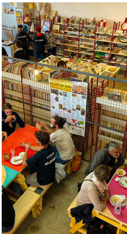
ESPACE CANTINE & EMMAÜS

La priorité sera donnée aux structures portant des projets tournés vers la transmission de savoirs et accueillant du public (cours, formations...)